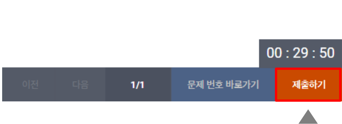
시험 화면 우측 하단 [제출하기] 버튼